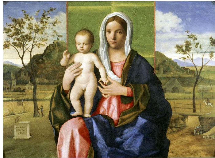
Fig. 2. Giovanni Bellini, Madonna col Bambino , Pinacoteca di Brera, Milano, 1510.