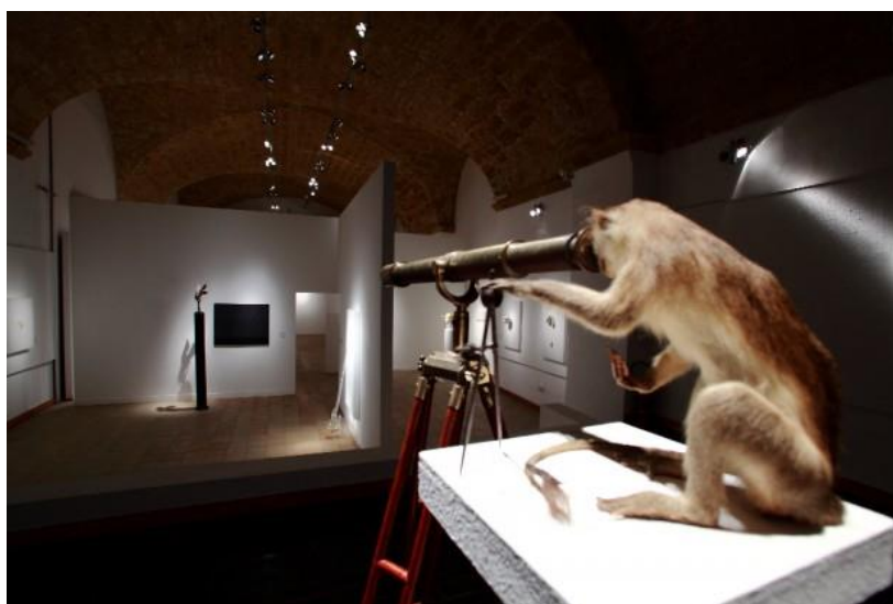
Fig. 8. Elio Marchegiani, scimmia con cannocchiale, 2013