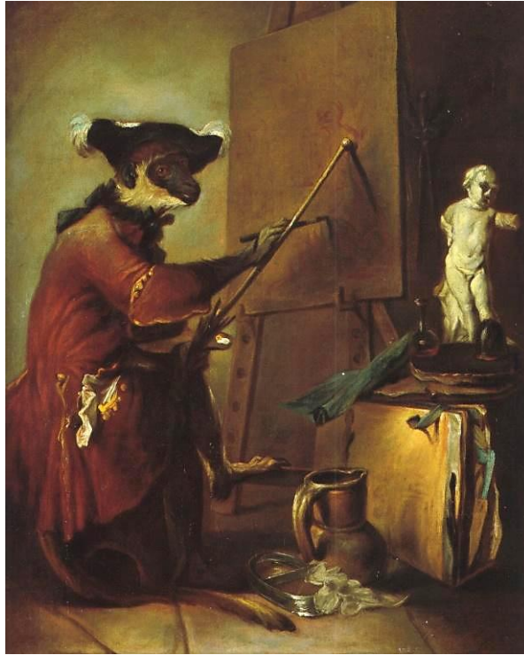
Fig. 1. Le Singe peintre , Jean Siméon Chardin, 1740, Musée du Louvre.