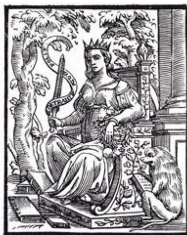
Fig. 5. Academia , dall'Iconologia di Cesare Ripa, Padova, 1630.