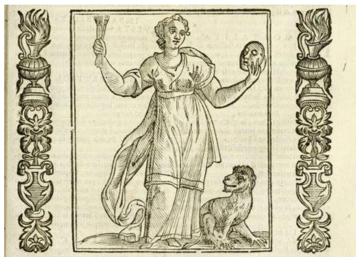
Fig. 4. Cavalier d'Arpino, Imitatione , dall'Iconologia di Cesare Ripa, Padova, 1625.