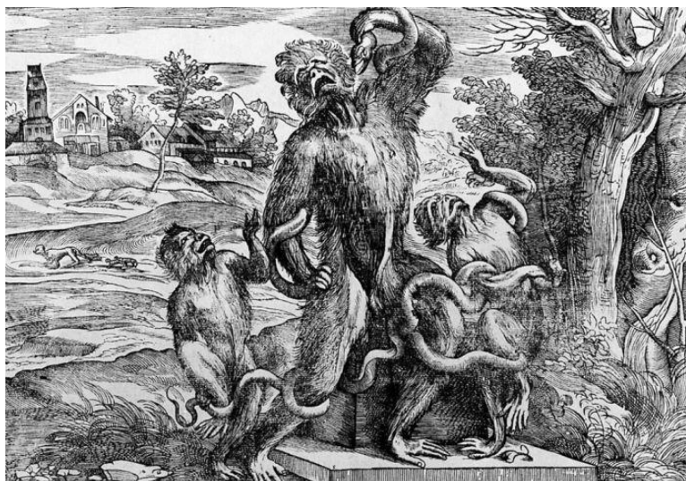
Fig. 6. Niccolò Boldrini, caricatura del Laocoonte, incisione, 1566.