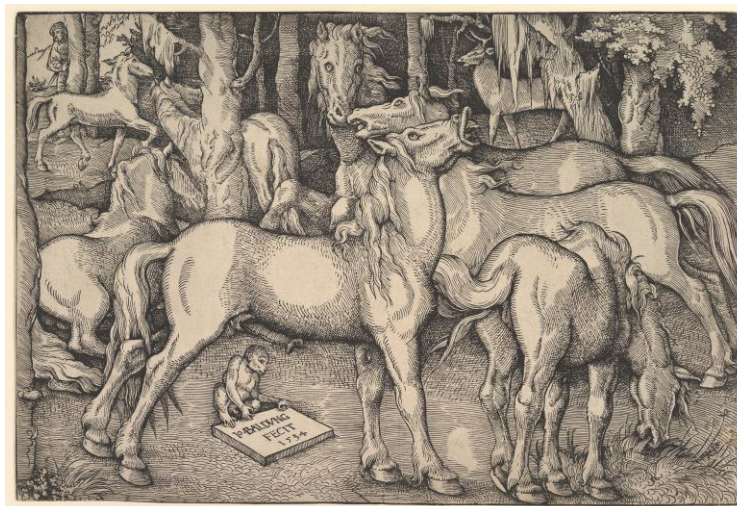
Fig. 3. Incisione da Hans Baldung Grien, Gruppo di sette cavalli, 1534.